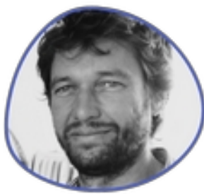
Etienne Jacques Collège des individuels