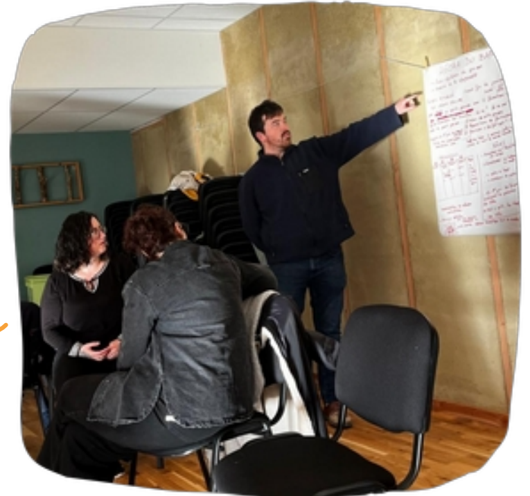
Formation de formateur·ice·s BAFA-BAFD 2025