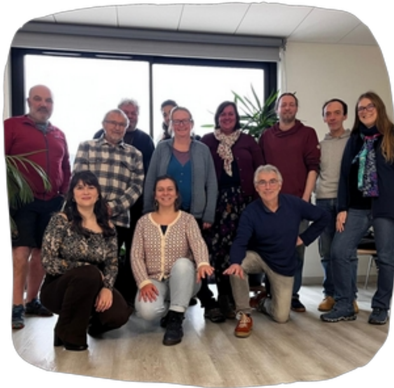
Journée de travail entre l'équipe de salariée et le CA à Rostrenen le 9 décembre 2025

Pour l'UBAPAR, 2026 c'est aussi l'occasion d'une restructuration de l'équipe et de plusieurs postes suite au départ de Riwanon puis de Paskall et de Liesel.