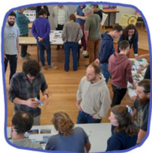
Journée de rencontre des professionnels de la jeunesse - Comment accompagner les jeunes vers un usage numérique éco-responsable ? (24 mars 2023)

Composée d'une douzaine de membres, cette commission regroupe des professionnel-le-s et des bénévoles du réseau, ainsi que des sympathisants issus de structures de l'Économie Sociale et Solidaire.