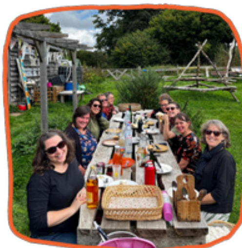
Réunion de la commission Loisirs Breton-Gallo en septembre 2024