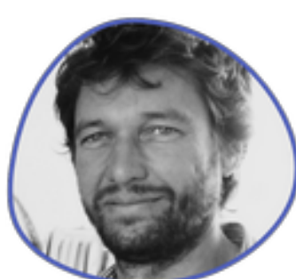
Etienne Jacques Collège des individuels