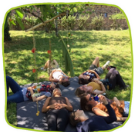
Formation « Éveil à la nature pour les tout-petits 0-3 ans » (Juin 2023)